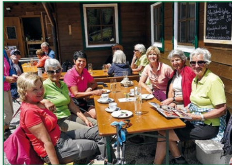
Verdiente Rast auf der Hochwildalm