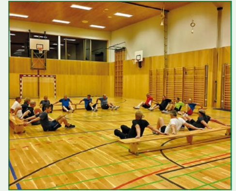
Erst die Arbeit, dann das Vergnügen

Mit der Hoffnung auf einen aktiven Start im Herbst verabschiedeten wir uns von einander in einen sonnigen und erholsamen Sommer.