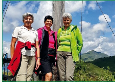
Gipfelstürmer am Goasbergl