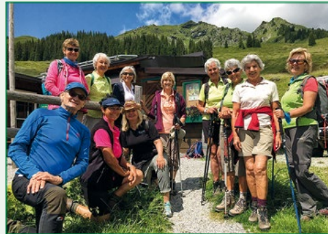
Gut gestärkt vor dem Abstieg